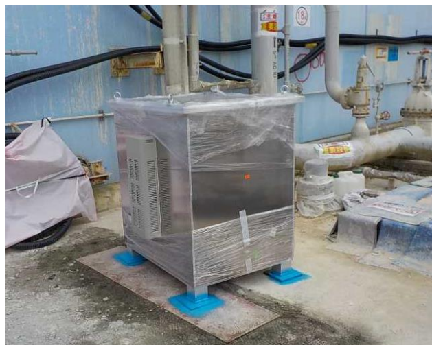
ミュオン測定装置設置 (小型装置, 約1m×1m×高さ1.3m)