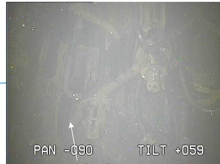
CRDハウジングサポート