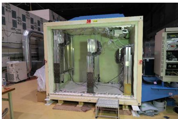
図2 1号機に設置した透過法測定装置

内部は空調器により温度が一定に保たれている。ミュオンヒットデータは光ファイバーを経由して免震棟内のパソコンに転送される。現場作業が制約されることが予想されることから、データの受送信や測定ユニットに障害が生じた際の電源のオン、オフ等は遠隔で制御される。